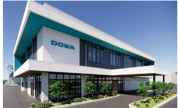
新工場が入居する建屋(完成予想図)